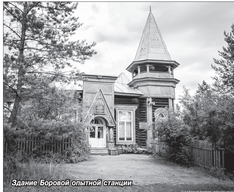
Здание Боровой опытной станции

Расчистка территории будет продолжаться всё лето. А осенью в коллекции древесно-кустарниковой растительности появятся предста-