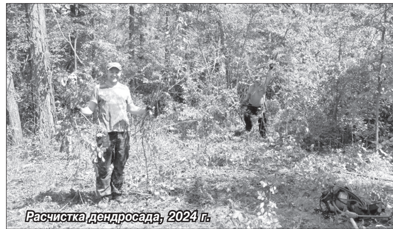
Расчистка дендросада, 2024 г.